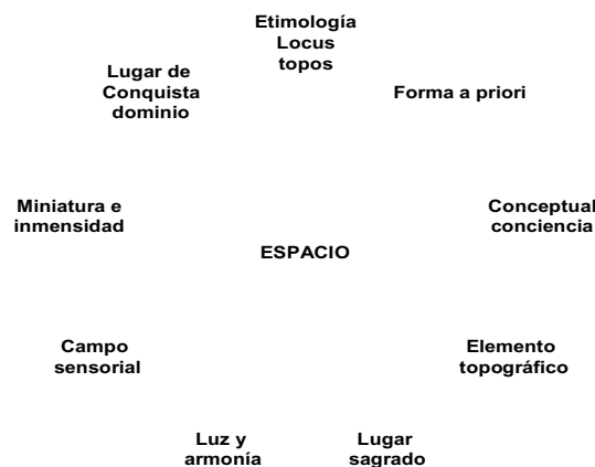
Fig. 1. Algunas dimensiones del espacio

La relación del espacio con el tiempo empezó a vislumbrarse en el sentido moderno con Leibniz y Kant. Leibniz afirmaba que el espacio es un orden de