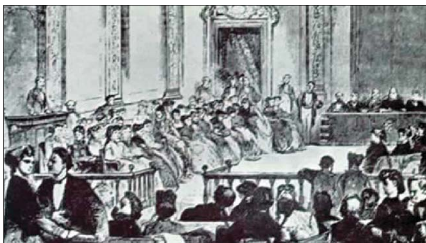
Fig. 2. Conferencias dominicales para la mujer en el Paraninfo de la Universidad de Madrid, por Fernando de Castro, 1869.

es riguroso, geométrico, estructurado, masculino y rígido. La visión de los centros escolares como núcleos idealizados y centros de la vida personal y profesional, y del aula como lugar sustituto e irreal de una familia, cobra especial relevancia en el caso de mujeres solas, que forman así una especie de familia numerosa monoparental con sus alumnos, al que dedican sus ilusiones y desvelos. Rara vez encontramos entre los varones esta idealización del espacio escolar ni el valor espacial familiar sustitutorio que se da entre las mujeres.